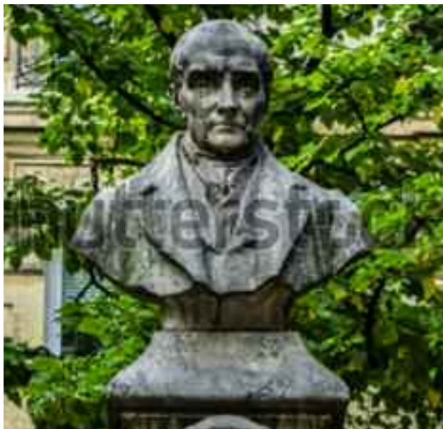
Παρίσι, Γαλλία. Τμήμα από το μνημείο προς τιμήν του Γάλλου φιλοσόφου Ογκίστ Κοντ στην πλατεία της Σορβόνης στο Παρίσι. Τα αποκαλυπτήριά του έγιναν το 1902.

Ο Κοντ ήθελε η κοινωνιολογία να γίνει μια «θετική επιστήμη» που θα χρησιμοποιούσε τις ίδιες σχολαστικές μεθόδους με την αστρονομία, τη φυσική και τη χημεία. Ο θετικισμός (positivism) είναι ένα θεωρητικό δόγμα που υποστηρίζει ότι η επιστήμη οφείλει να ασχολείται μόνο με παρατηρήσιμα γεγονότα τα οποία μπορούν να γίνουν άμεσα αντιληπτά. Έπειτα,