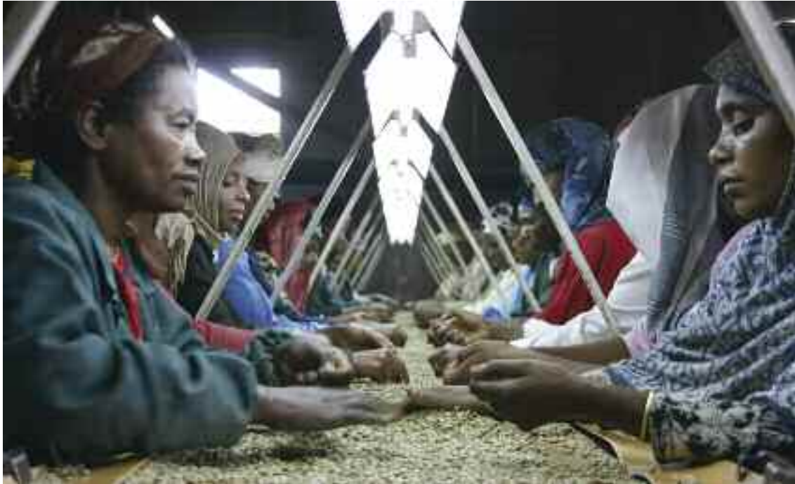
Ο καφές είναι κάτι περισσότερο από ένα απολαυστικό ρόφημα γι' αυτούς τους εργάτες, ο βιοπορισμός των οποίων εξαρτάται από το καφεόδεντρο.

τους ανθρώπους των πλουσιότερων χωρών με αυτούς που ζουν στα πιο φτωχά μέρη του κόσμου. Καταναλώνεται κυρίως στις σχετικά πλούσιες χώρες αλλά καλλιεργείται κυρίως στις σχετικά φτωχότερες. Ο καφές είναι ένα από τα πολυτιμότερα αγαθά του διεθνούς εμπορίου και για πολλές χώρες αποτελεί τη μεγαλύτερη πηγή συναλλάγματος. Η παραγωγή, η μεταφορά και η διανομή του καφέ προϋποθέτουν συνεχείς συναλλαγές μεταξύ ανθρώπων που βρίσκονται σε απόσταση χιλιάδων χιλιομέτρων από τον καταναλωτή. Η μελέτη τέτοιων παγκόσμιων διασυνδέσεων αποτελεί ένα σημαντικό έργο των κοινωνιολόγων.