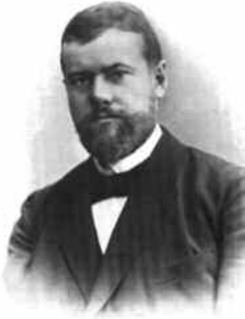
Μαξ Βέμπερ (1864-1920).

δημιουργούνται για να επιστήσουν την προσοχή μας σε κάποιο κοινωνικό φαινόμενο και να μας βοηθήσουν στην κατανόησή του. Αυτές οι υποθετικές κατασκευές μπορούν να αποβούν πολύ χρήσιμες στο να κατευθύνουν τους ερευνητές προς ένα συγκεκριμένο θέμα. Παραδείγματος χάρη, μπορούμε να κατασκευάσουμε μια απλή ιδεοτυπική «τρομοκρατική ομάδα», χρησιμοποιώντας τις πιο χαρακτηριστικές πτυχές όσων