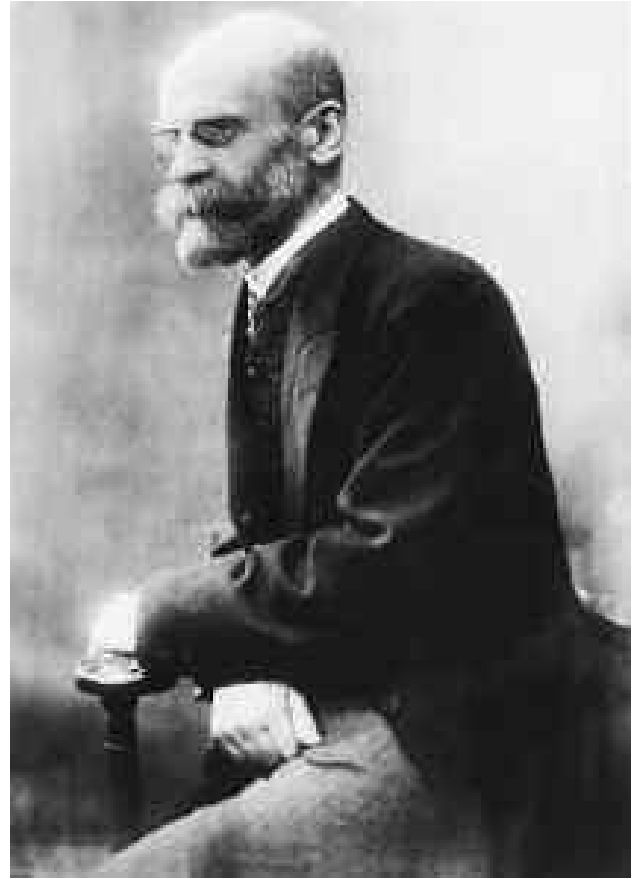
Εμίλ Ντυρκέμ (1858-1917).

Τι είναι όμως ένα κοινωνικό γεγονός (social fact); Ο Ντυρκέμ εξηγεί ότι τα κοινωνικά γεγονότα είναι το σύνολο των θεσμών και των κανόνων δράσης που θέτουν περιορισμούς ή που κατευθύνουν την ανθρώπινη συμπεριφορά. Για το άτομο, τα κοινωνικά γεγονότα μπορεί να δίνουν την εντύπωση ότι αποτελούν μια εξωτερική δύναμη, παρότι τις περισσότερες φορές τα θεωρούμε δεδομένα ως «φυσικά» ή «κανονικά» μέρη της ζωής. Λόγου χάρη, το νομισματικό σύστημα είναι ένα κοινωνικό γεγονός το οποίο σπανίως σκεφτόμαστε. Πληρωνόμαστε με χρήμα, δανειζόμαστε χρήμα