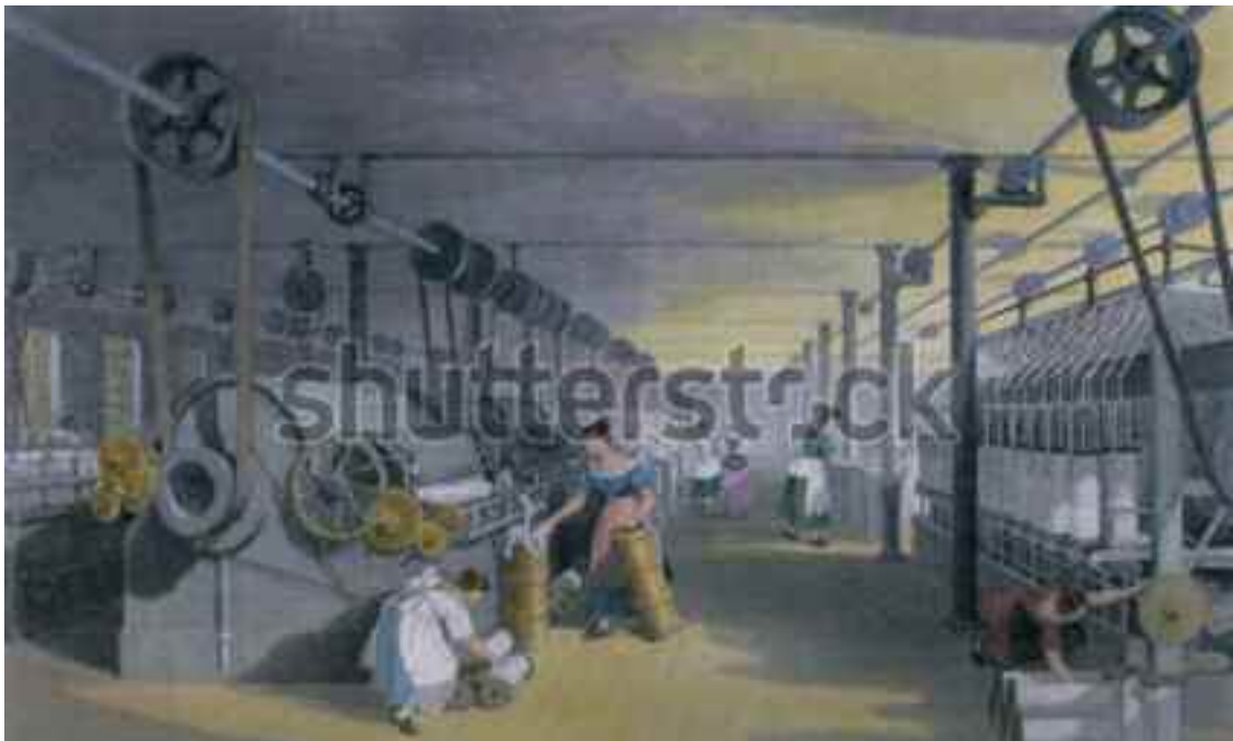
Βιομηχανική επανάσταση. Μηχανές που κατασκευάζουν νήμα βαμβακιού με μηχανικές εκδοχές λαναρίσματος και ραβδώσεων σε μύλο στο Λανκσάιρ το 1835 (χαρακτική με σύγχρονη ακουαρέλα).

Στις σύγχρονες κοινωνίες πολλοί λίγοι άνθρωποι υιοθετούν τέτοιες πρακτικές ή πιστεύουν σε παρόμοια πράγματα. Αντίθετα, μια περισσότερο επιστημονική προσέγγιση στο θέμα της υγείας και των ασθενειών σημαίνει ότι τα παιδιά εμβολιάζονται ενάντια σε προηγούμενες κοινές ασθένειες και μαθαίνουν πως οι εφιάλτες είναι φυσιολογικοί και γενικά ακίνδυνοι, ενώ τα