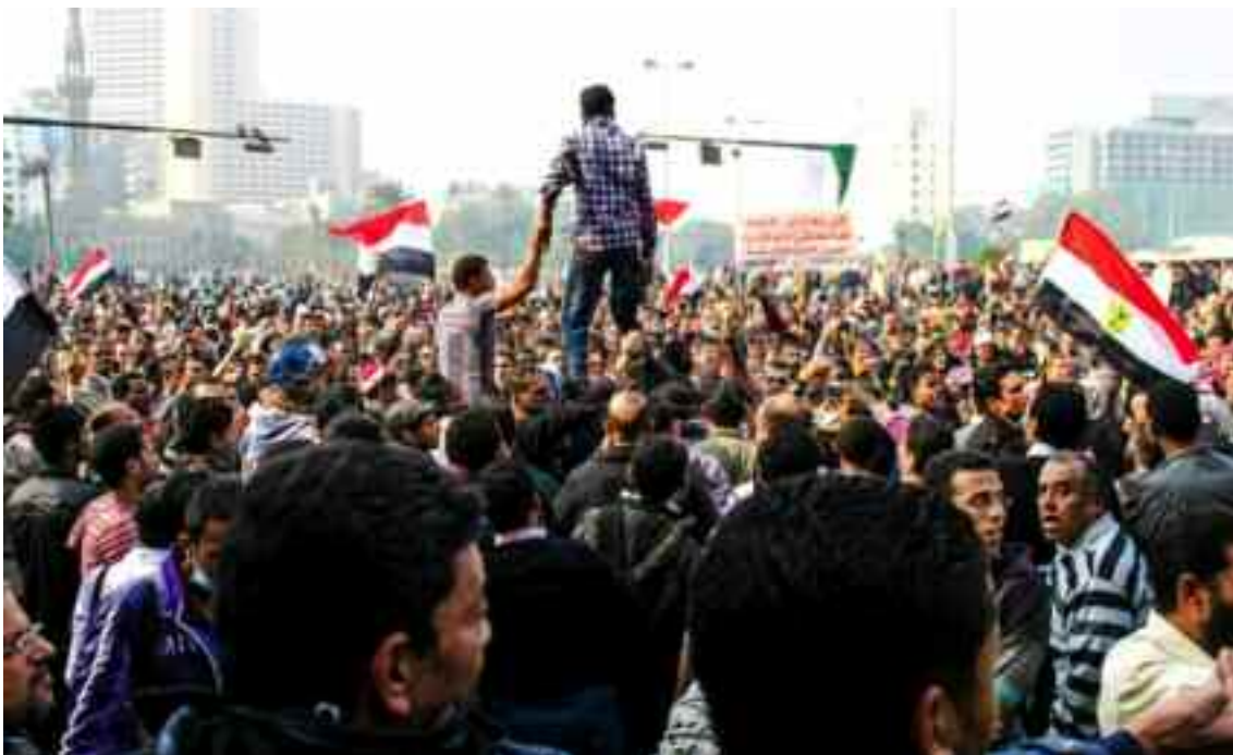
Επαναστατικά γεγονότα, όπως η Αραβική Άνοιξη, μας δείχνουν ότι οι κοινωνικές δομές βρίσκονται πάντα «εν εξελίξει» και δεν είναι ποτέ δεδομένες, όσο σταθερές και «φυσικές» και αν δείχνουν. Σκηνή από διαδήλωση στην πλατεία Ταχρίρ του Καΐρου, στις 22 Νοεμβρίου 2011.

Παρότι η ιδέα της «δόμησης» παραπέμπει σε κτίριο, στην πραγματικότητα οι κοινωνικές δομές δεν μοιάζουν με τις φυσικές, οι οποίες, άπαξ και δημιουργηθούν, υπάρχουν ανεξάρτητα από τις πράξεις μας. Οι ανθρώπινες κοινωνίες βρίσκονται πάντα σε διαδικασία δομοποίησης (structuration) (Giddens, 1984). Αυτό σημαίνει ότι ανασυγκροτούνται ανά πάσα στιγμή από τις ίδιες τις «δομικές λίθους» που τις συνθέτουν, δηλαδή από ανθρώπους σαν και εμάς. Σκεφτείτε και πάλι την περίπτωση του καφέ. Ένα φλιτζάνι με καφέ δεν πέφτει στα χέρια σας από τον ουρανό. Επιλέγετε να πάτε σε ένα συγκεκριμένο καφέ, επιλέγετε το αν θα πιείτε λάτε, καπουτσίνο ή εσπρέσο. Ενώ κάνετε αυτές τις επιλογές, μαζί με εκατομμύρια άλλους