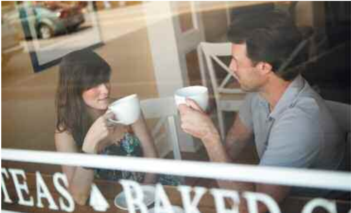
Οι συναντήσεις μεταξύ φίλων για καφέ είναι μέρος μιας τελετουργίας η οποία, εκτός των άλλων, τοποθετεί τους ανθρώπους εντός του ευρύτερου κοινωνικού τους πλαισίου.

χε ονομάσει κοινωνιολογική φαντασία (sociological imagination).